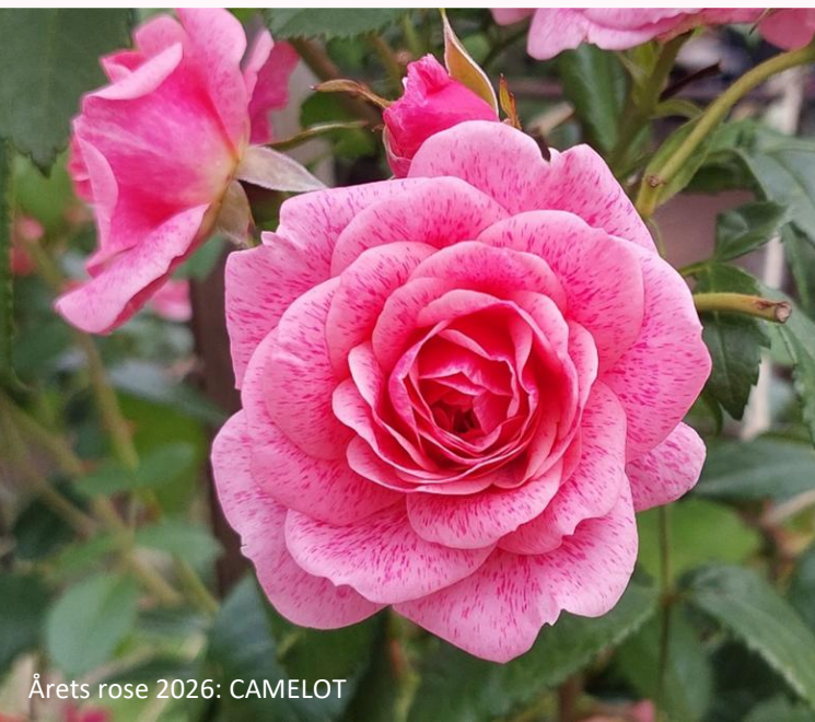
Årets rose 2026: CAMELOT

Vårt formål er å fremme kunnskap om og interesse for rosedyrking. Det gjør vi gjennom utgivelse av tidsskriftet Rosebladet, foredrag, og ved å arrangere møter og aktiviteter for medlemmene.