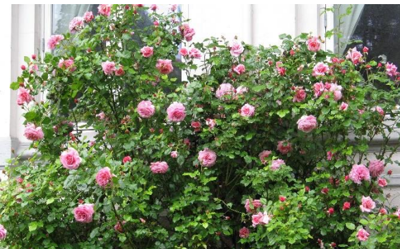
'Aloha' (Boerner, 1949) i Bergen sentrum