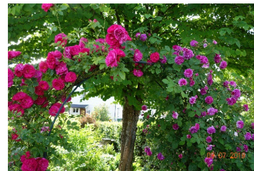
John Cabot og Russelliana